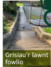
Grisiau'r lawnt fowlio

Yng nghanol y parc mae cyrtiau tenis gyda meinciau.