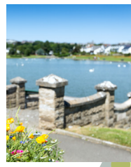
Grisiau i'r Promenâd.