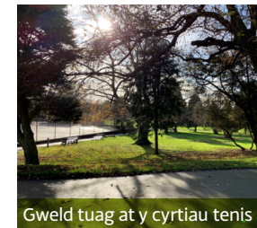
Gweld tuag at y cyrtiau tenis