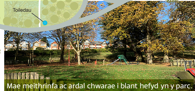
Mae meithrinfa ac ardal chwarae i blant hefyd yn y parc.

I gyrraedd y lefel nesaf uwchben y cyrtiau tenis mae 14 o risiau yn eich arwain at y lawnt fowlio sydd mewn lleoliad prydferth iawn ac sydd â'i gysgod ei hun gyda seddau'n edrych dros y cyrtiau tenis.