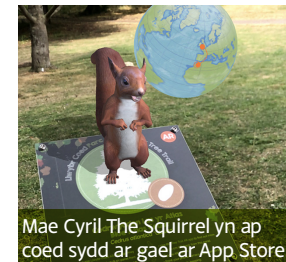
Mae Cyril The Squirrel yn ap coed sydd ar gael ar App Store