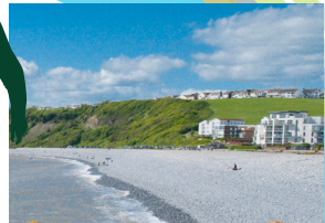
Promenâd y Cnap a'r traeth cerrig mân.

Mae 10 mainc o amgylch y pwll felly mae digon o lefydd i gael picnic. Dylid bod yn ofalus wrth gerdded o amgylch y pwll gan y gall y slabiau fynd yn llithrig pan fyddant yn wlyb.