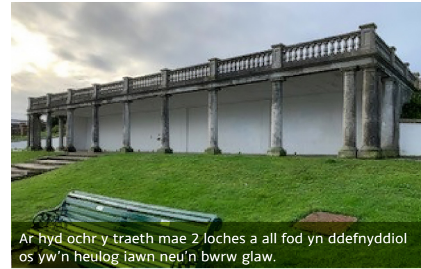
Ar hyd ochr y traeth mae 2 loches a all fod yn ddefnyddiol os yw'n heulog iawn neu'n bwrw glaw.

Mae 10 mainc o amgylch y pwll felly mae digon o lefydd i gael picnic. Dylid bod yn ofalus wrth gerdded o amgylch y pwll gan y gall y slabiau fynd yn llithrig pan fyddant yn wlyb.