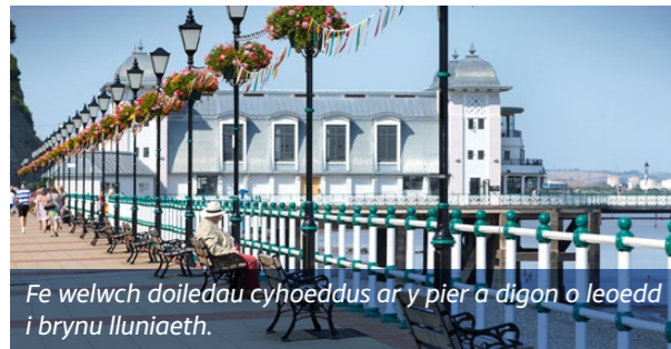
Fe welwch doiledau cyhoeddus ar y pier a digon o leoedd i brynu lluniaeth.

Wrth allanfa Parc Alexandra trowch i'r chwith i Bridgeman Road a cherddwch i lawr y bryn byr i gyrraedd y Pier.