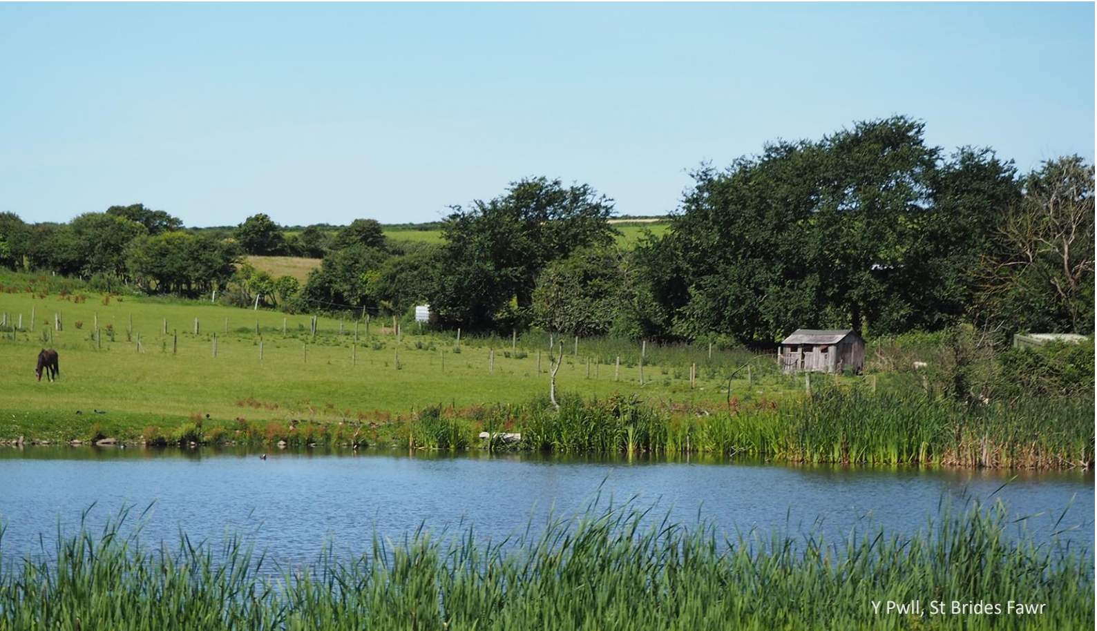
Y Pwll, St Brides Fawr