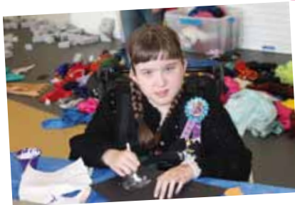
Cymru a bydd