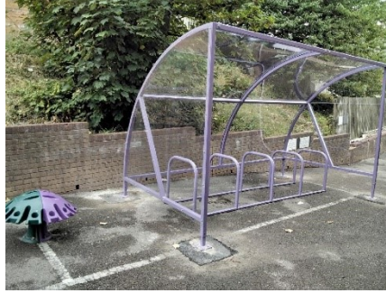
Ysgol Sant Curig

Mae'r Cyngor yn cynnig cyrsiau Hyfforddiant Beicio Safonol Cenedlaethol (HBSC) Lefelau 1 a 2 i bob ysgol gynradd ar gyfer ei disgyblion Blwyddyn 6 a'r flwyddyn ariannol hon, cynhaliodd bum cwrs ar draws yr awdurdod ar gyfer plant 9-11 oed, yn ystod gwyliau'r ysgol ym mis Gorffennaf, mis Awst a mis Chwefror. Galluogodd hyn 656 o fyfyrwyr yn 22/23 i ddechrau eu HBSC, gan ragori ar ein ffigur targed, gyda 533 o'r disgyblion hyn yn cyrraedd Lefel 1 a 354 yn mynd ymlaen i basio eu Lefel 2.