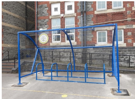
Ysgol Gynradd Tregatwg

Blwyddyn ariannol 22/23 - darparwyd cyfleusterau storio sgwteri a beiciau mewn 5 ysgol arall yn y Fro (Cronfa TLI Graidd).