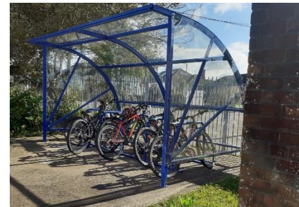
Ysgol Gynradd Sili

Rhodddwyd cyfleusterau storio sgwteri i 16 ysgol a rhodddwyd cyfleusterau storio beiciau i 7 ysgol yn y Fro.